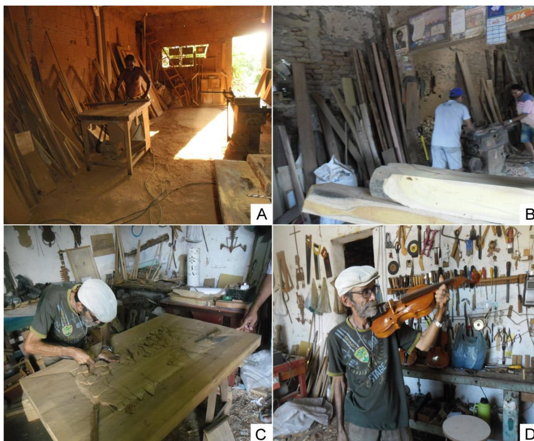
Figura 2. Sujeitos participantes da pesquisa entrevistados na cidade de Aurora: A–B. Marceneiros, C. Escultor, D. Luthier.